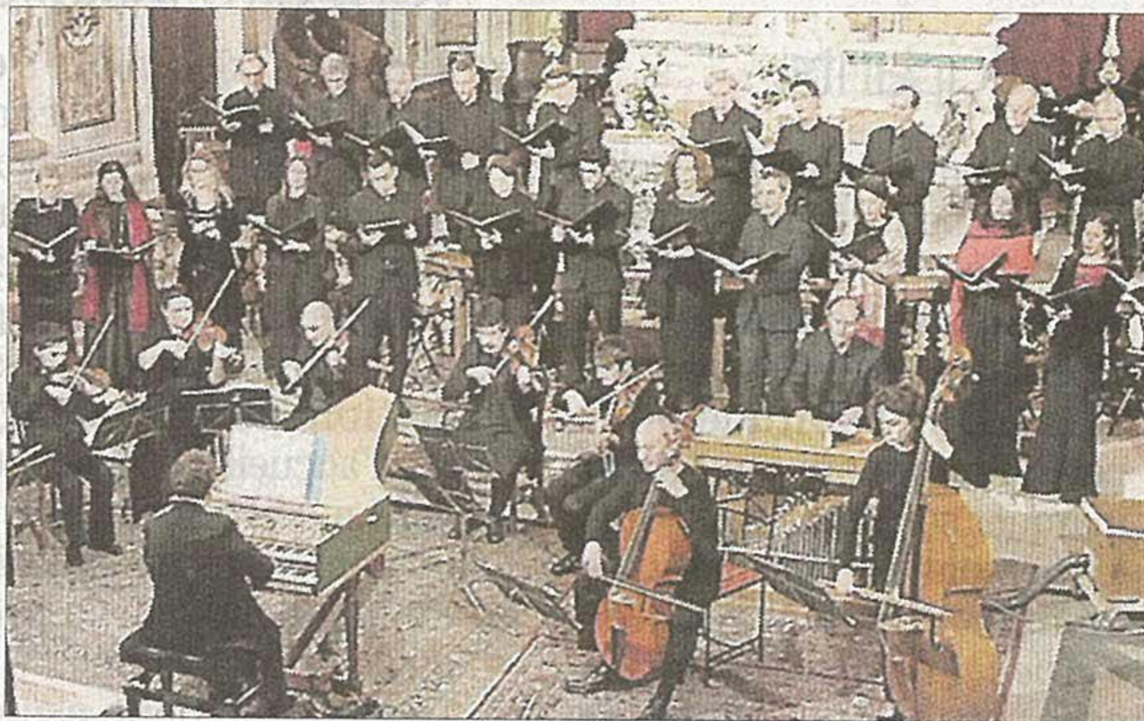
■ Pour Noël, Ars Vocalis au sommet de son art. CATIE CHAPELIER

Le chœur Ars Vocalis – une trentaine d'interprètes – enchaîne les épisodes, magnifiquement illustrés par les solistes, contre-ténor et sopranos. On joue sur les contrastes, impressionnants. Le passage guerrier, qui évoque le châtimeur ultime et la ruine